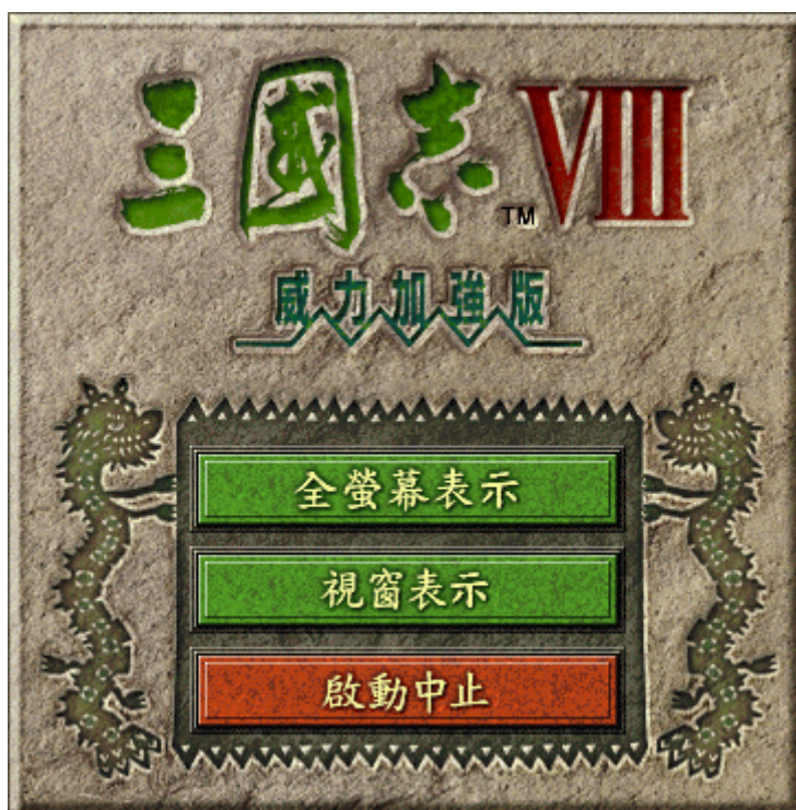
图 4 游戏程序提示窗口