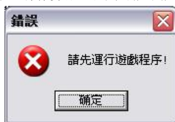
图 3 错误提示

作弊器是通过查找游戏程序的主窗口来判断游戏是否已经运行，因此一定要真正进入游戏主窗口后再运行作弊器。如果在游戏程序出现提示窗口（如图 4）时，就运行作弊器，那么就会提示先运行游戏程序。另外，最好是在真正进入游戏画面之后再运行作弊器，而不要在游戏出现初始画面（图 5）时就运行作弊器，否则可能不能获取历史武将。