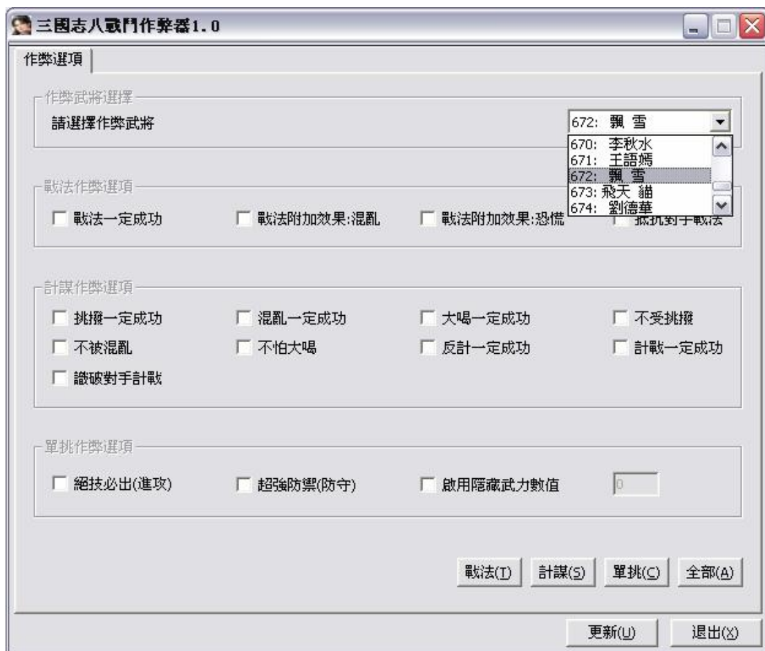
图 2 选择作弊武将

(3) 计谋作弊选项：图 1 中中间最大的一个灰框框起来的部分，包括多达 9 个选项可供选择。