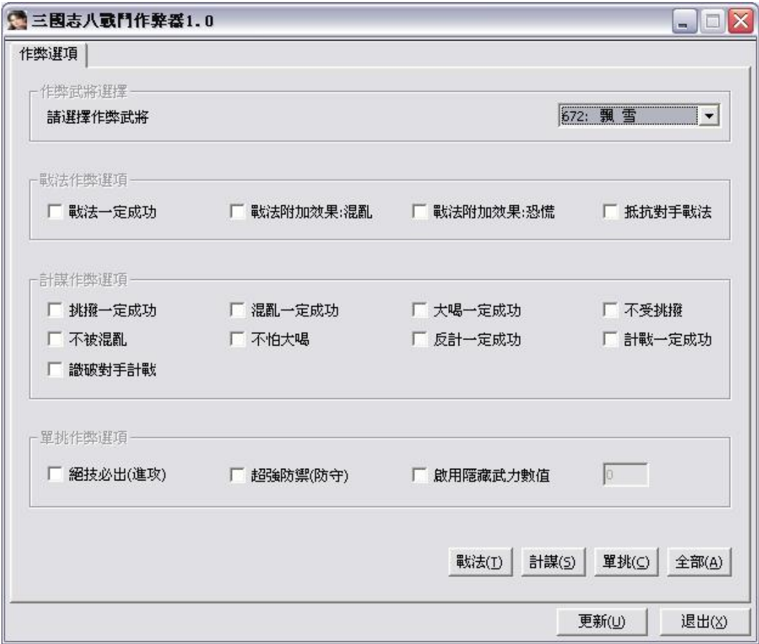
图 1 程序主界面

程序的主界面很简单，就是一些 check box，勾上就表示启用相应的作弊选项。界面如下图所示。